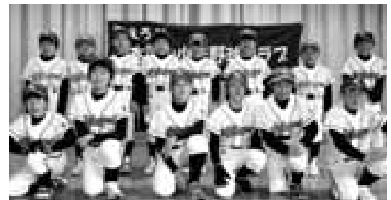
中太閤山少年野球クラブ

中太閤山少年野球クラブは中太閤山小学校グラウンドを拠点に活動する軟式野球チームです。新学期になり、新たな仲間も増え益々元気のあるチームになりました。又毎年春と夏に大阪のチームと交流して野球の技術の向上を図るとともに親睦を深めています。まだまだメンバー募集中です!! いつでも見に来てね。 HP http://www.nakataiboys.sakura.ne.jp/