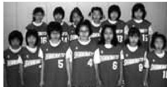
新湊ミニバスケットボールクラブ

新湊ミニバスケットボールクラブは、新湊小学校体育館で活動しています。新湊ミニバスは、体力づくり・基本練習・チームワーク・バスケットボールを将来続けてくれる事を目標に置き練習しています。男女部員を募集していますから、体験・お試しをしてみたい方はいつでも見に来てください。